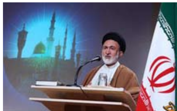
سرپرست حجاج ایرانی:

در پایان حجت‌الاسلام قاضی عسگر با اشاره به رابطه بسیار نزدیک بعثه مقام معظم رهبری و سازمان فرهنگ و ارتباطات اسلامی موارد مشترک همکاری رایزنان محترم فرهنگی و بعثه مقام معظم رهبری را برشمرد و خواهان گسترش این همکاری‌ها شد.