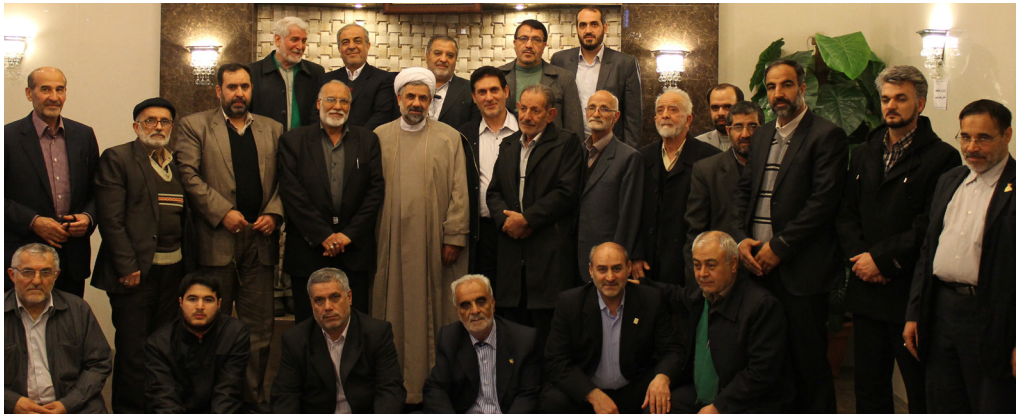
نمایندگان استانی بنیاد دعبل و اعضای هیئت مدیره بنیاد دعبل - مشهد - بهمن ۱۳۹۲

حجت الاسلام ثمری در اعتراض به فیلم «رستاخیز» یادداشتی نوشت و در بخش هایی از آن آورد: «آنچه در فیلم به عنوان عاشورا مطرح می شود با مفاهیم بلند عاشورا هیچ انطباقی ندارد.» وی همچنین تصریح کرد: «در رستاخیز صرفاً با تکنیک های هنری، کارزاری نمایش داده شده که هدفش فقط خشونت است.»