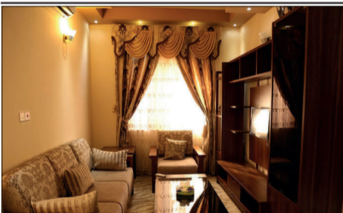
شهرک های پیشرفته اقامتی ویژه زائران حسینی آماده شد

رئیس سازمان حج و زیارت با بیان اینکه تا امروز چیزی به ما ابلاغ نشده است ادامه داد: ما جمع بندی خود را ارائه دادیم،