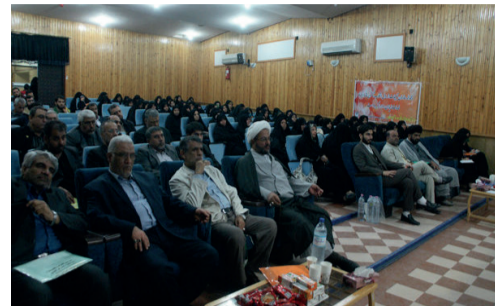
اولین همایش مداحان جوان سراسر کشور برگزار می شود

وی بر لزوم بازنگری در اعضای کانون مداحان و شاعران آئینی تأکید کرد و گفت: این مداحان اگر خودشان را اصلاح نکنند کارت عضویت آنها باطل می شود.