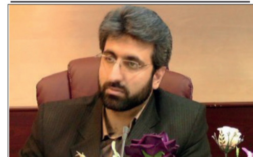
کانون مداحان و شورای هیئات مذهبی کمک کار و تصمیم ساز سازمان تبلیغات است