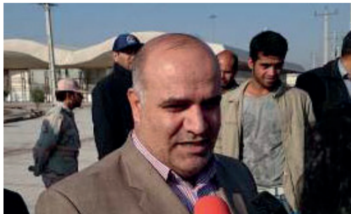
سفر به کربلا با خودروی شخصی آزاد شد

زمینه سفر زائران عتبات عالیات از ایران به کشور عراق با خودروی شخصی از مرز بین المللی شلمچه در استان خوزستان فراهم شد.