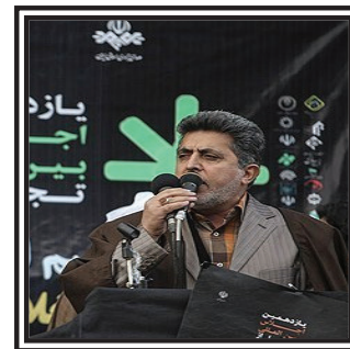
مدیرعامل خانه مداحان هشدار داد: ایجاد فاصله بین مداحان جوان و پیشکسوت نگران کننده است

خبرنامه هفتگی دعبل - برگزیده مطالب پایگاه اطلاع رسانی دعبل - شماره هفتاد و یکم، ۳۰ مهر ۹۴