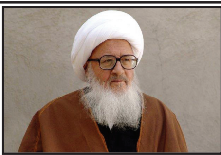
توصیه‌های آیت‌الله وحید خراسانی به زائرین اربعین حسینی

آیت‌الله وحید خراسانی از مراجع عظام تقلید، نکته‌ها و سفارش‌هایی به زائرین اربعین مطرح کرد که متن کامل آن به شرح زیر است. بسم الله الرحمن الرحيم زوار قبر سیدالشهداء علیه السلام اگر بدانند کجا می‌روند و به زیارت چه کسی مشرف می‌شوند، سر از پا در این سفر نمی‌شناسند.