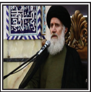
استاد فاطمی نیا: