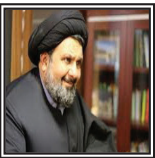
دبیر جامعه و عاظم و مبلغین جهان اسلام:

نباید امام حسین (ع) را در نوحه ها مصادره کنیم