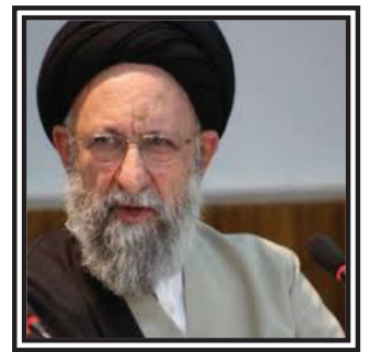
آیت الله سید کاظم نورمفیدی:

نود درصد عزاداری ها از محتوا خارج شده و به ظواهر می پردازند