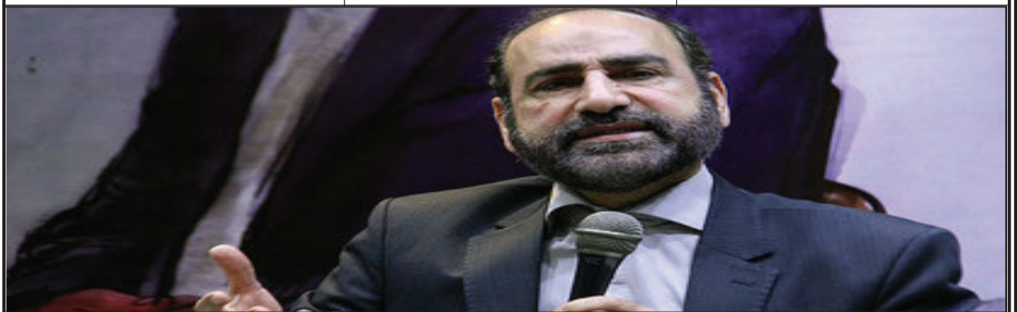
عضو هیات علمی بنیاد دعبل خراعی:

وی با بیان این که برخی از نویسندگان درگیر بیان حواشی حادثه کربلا هستند، اظهار کرد: باید تلاش کنیم تا محتوای کربلا را دریابیم. اگر نه بررسی دقیق تعداد نفرات و یاران