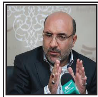
رئیس کانون مداحان کشور:

آموزش کارگاهی مداحان در ۱۶ استان کشور پیگیری می شود